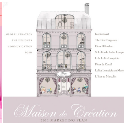
LOLITA LEMPICKA Illustration & animation