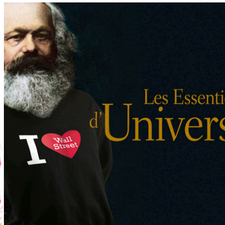
LE MONDE UNIVERSALIS Site web & rich media