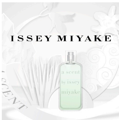
ISSEY MIYAKE Présentation interactive