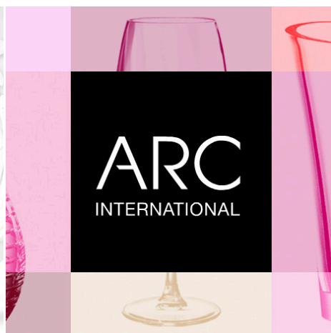
ARC RETAIL Digital signage & motion design