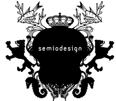
SEMIO DESIGN Identité & typographie