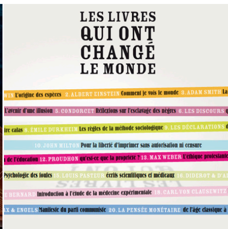
LE MONDE LES LIVRES Site web & rich media