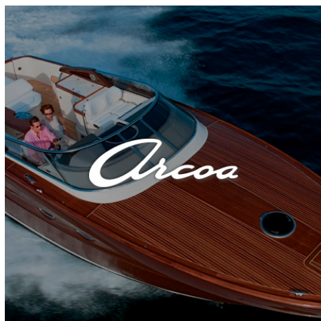
ARCOA YACHTS Site web v1